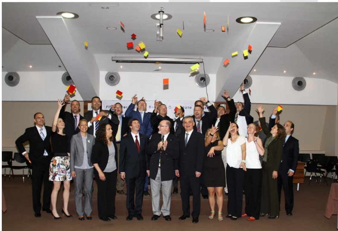
Fotografija za pamćenje: kurs je završen!