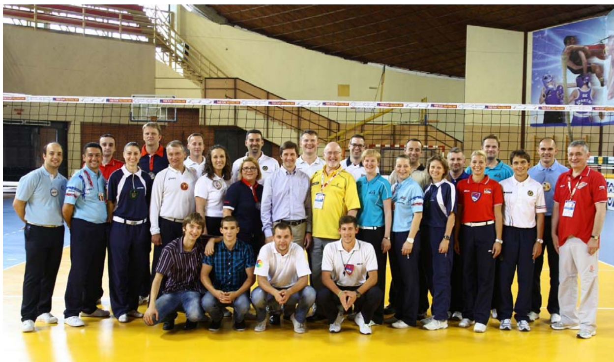
Zadovoljstvo u »Dudovoj šumi«