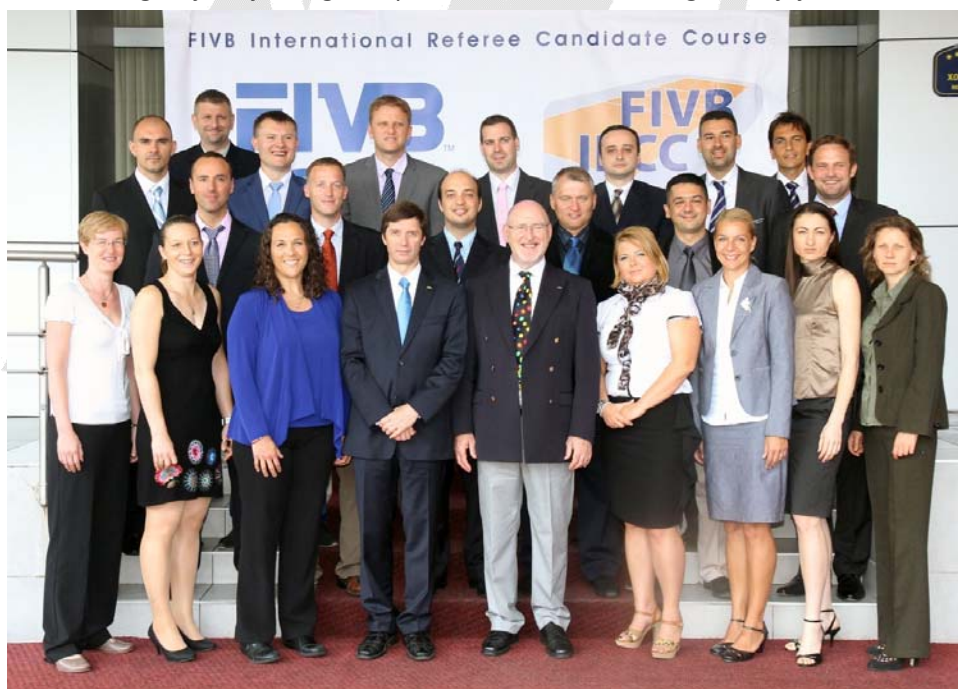
Kandidati sa instruktorima

Evo i nekoliko fotografija koje mogu da prikažu makar deo našeg doživljaja: