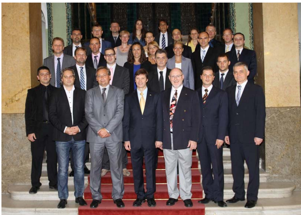
Prijem kod gradonačelnika Subotice