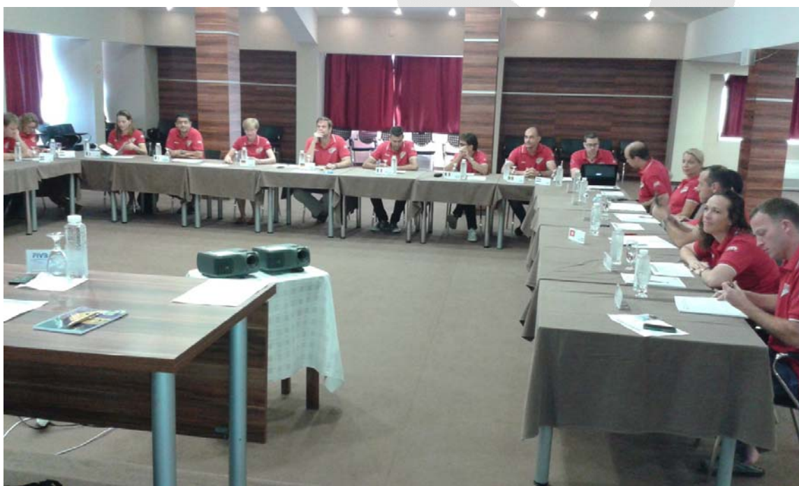
Za uniformisanost i „sveže“ izraze lica je zaslužna naredna fotografija