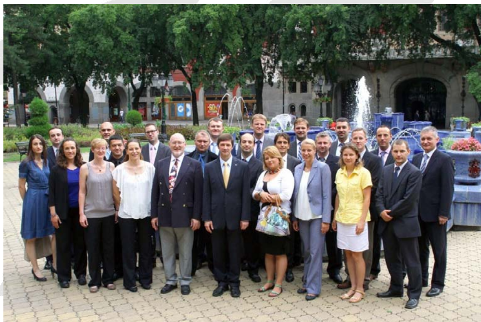
U centru grada