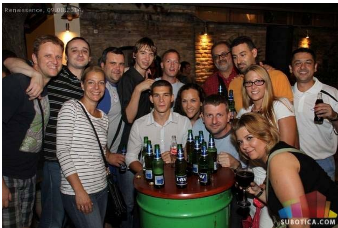
Učenje do kasno u noć