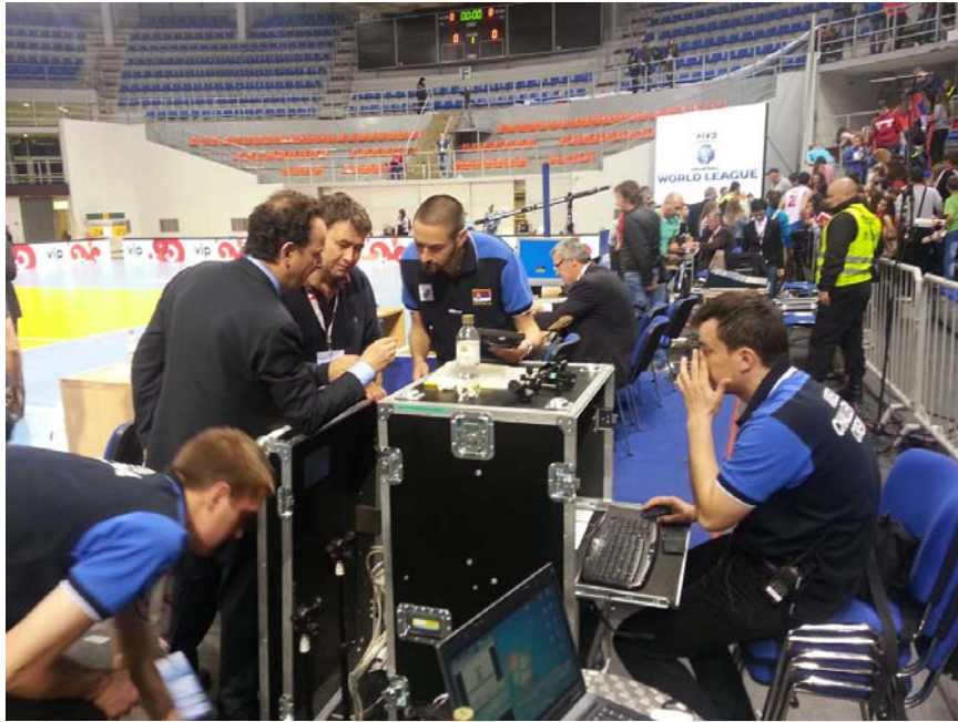
Posle druge utakmice

Nakon druge utakmice, sudije su nam zahvalile na saradnji i čestitali nam na „uhvaćenim“ svim spornim momentima, ali sutradan smo od strane kolega iz Italije primili najiskrenije čestitke za brzinu i kvalitet obavljenog posla, tvrdeći da smo u situacijama popravki kamera nakon njihovog pomeranja bili efikasniji i od italijanskih operatera. Što se mene tiče, imao sam jedno jako lepo iskustvo, sa kombinacijom najbolje odbojke i savremene tehnike i mislim je čelendž ekipa spremna da dočeka ekipu Bugarske krajem meseca. Hvala na izdvojenom vremenu, do sledećeg čitanja,