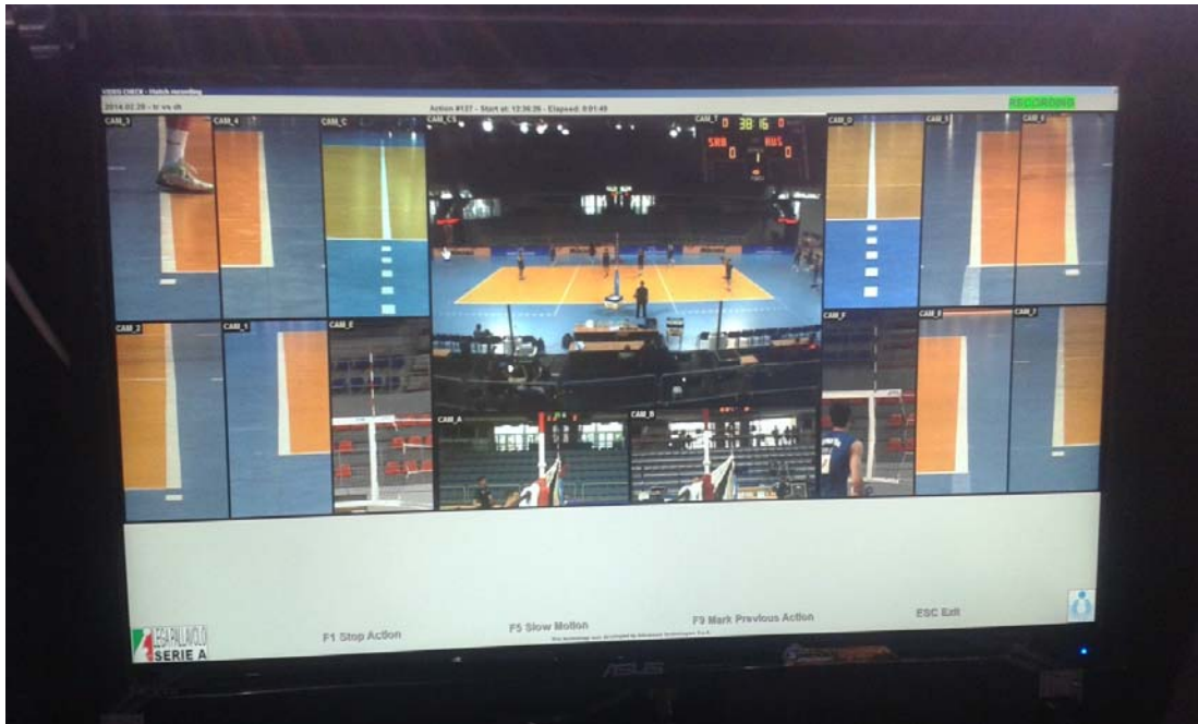
Prikaz slike svake kamere na našem monitoru

Naš zadatak za vreme utakmice kao operatera bio je da nakon zatraženog čelendža od strane trenera, preotamo snimak drugom sudiji i pružimo mu najbolji mogući ugao za uvid situacije zbog koje je čelendž zatražen. Nakon toga, drugi sudija odlazi nazad do terena i donosi odluku, a mi u saradnji sa RTS-om „puštamo“ spornu situaciju u direkran prenos, kao i na veliki video bim u hali „Čair“. Na stolici prvog sudije je pričvršćen jedan manji monitor, na kojem i on jasno može da pregleda sporni momenat.