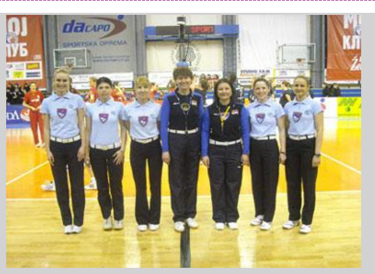
2010 – National Cup Finals